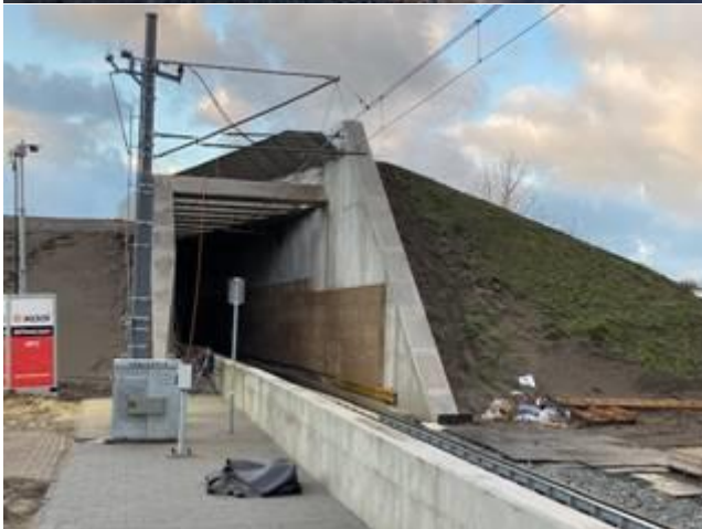
Spoorovergang Strandweg met file lichten