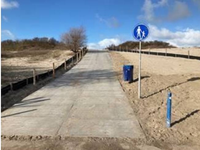
Bestrating Strandplein voorzijde station Strand strand