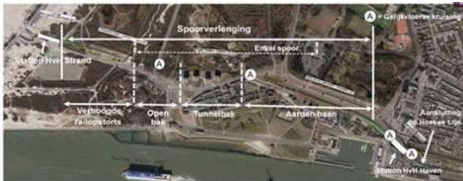
Schematisch overzicht van de werkzaamheden

De laatste twee grote buitenruimteprojecten: het nieuwe Strandplein en de ovale rotonde (Ovonde) op de kruising Badweg/Strandweg/Strandboulevard zijn volop in uitvoering.