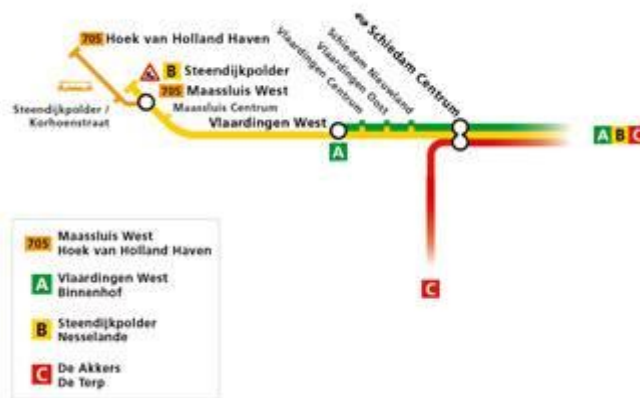
RET Folder aangepaste reis door werkzaamheden Hoek van Holland