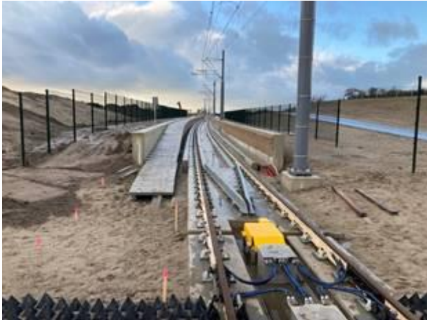
Open bak oostwestzijde Strandboulevard