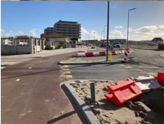
Spoorovergang Strandboulevard en aansluiting op Ovonde De Boulevard