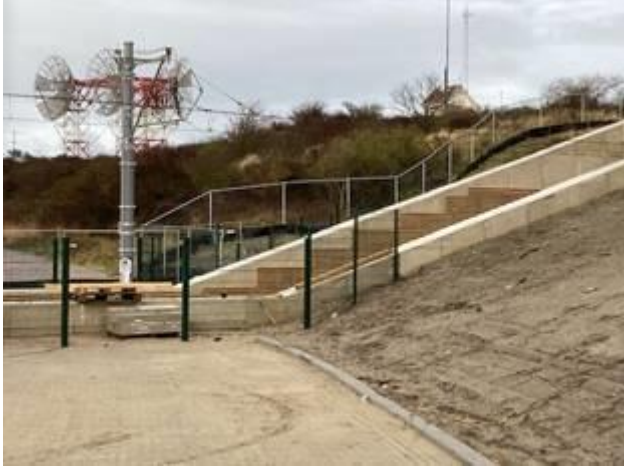
Rietpollen tegen verstuiving vanaf tunneldak