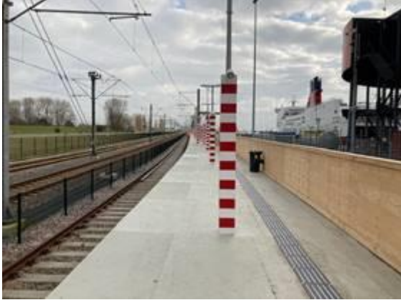
Locatie koppeling spoorverlenging op Hoekse Lijn Nieuw tijdelijk perron station Hoek van Holland Haven