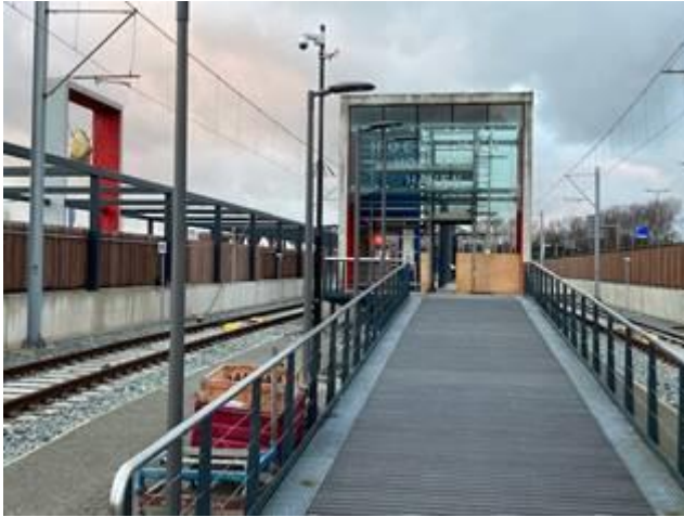
Station Hoek van Holland Haven (westzijde)