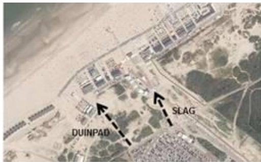
Uitvoering Strandplein: nieuw werkgebied(lichtblauw) Slag